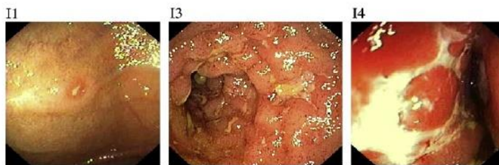
Fig. 1. Endoscopic view of recurrence score (example of i1, i3, and i4 findings).

Stade i,4 : iléite diffuse avec ulcérations plus larges, nodules et/ou sténose